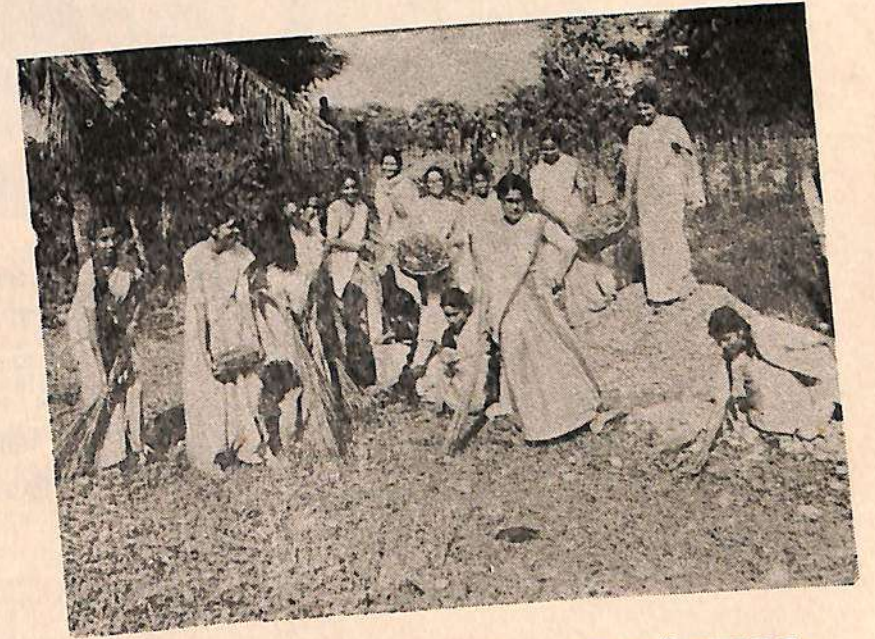
কলেজৰ ছাত্ৰীসকলে কলেজ চৌহদত সমাজ উন্নয়নমূলক কাম কৰাৰ দৃশ্য ॥