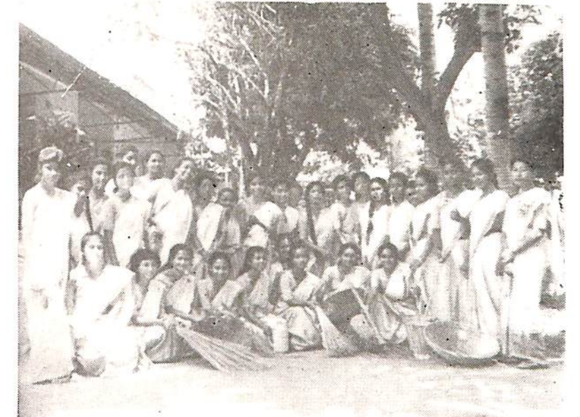
এন, এন, এচ, বিভাগৰ জৰিয়তে কলেজ চৌহদ কাৰ্য্যসূচীত অংশ গ্ৰহণ কৰা ছাত্ৰীসকলৰ একাংশ।