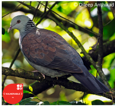
Image 1. Nilgiri Wood-Pigeon