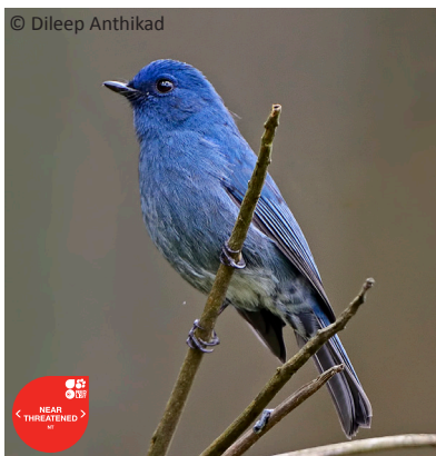
Image 18. Nilgiri Flycatcher