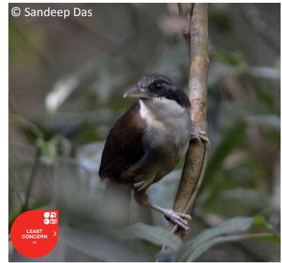
Image 13. Wynaad Laughingthrush