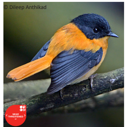
Image 19. Black-and-orange Flycatcher