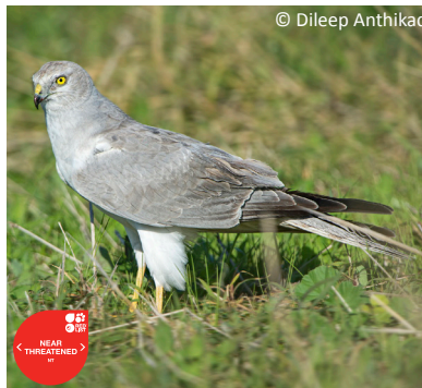
Image 8. Pallid Harrier