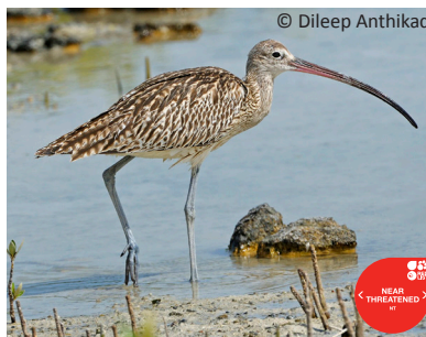
Image 5. Eurasian Curlew