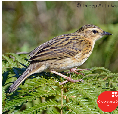
Image 12. Nilgiri Pipit