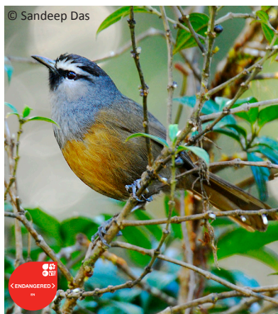
Image 17. Black-chinned Laughing-thrush (Banasura Laughing-thrush)