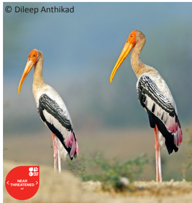
Image 2. Painted Stork