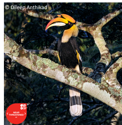
Image 9. Great Indian Hornbill