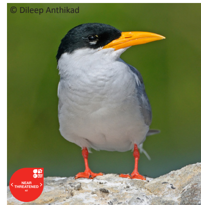
Image 6. River Tern