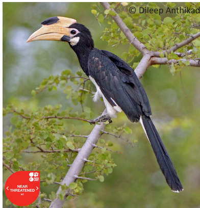
Image 11. Malabar Pied Hornbill