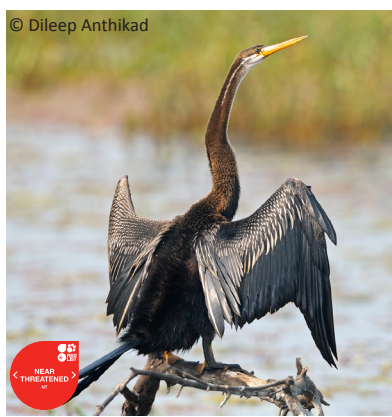
Image 4. Oriental Darter