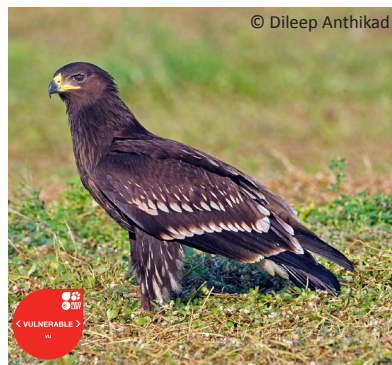
Image 7. Greater Spotted Eagle