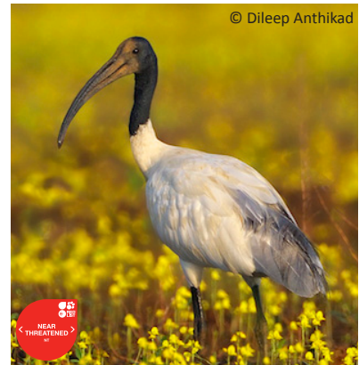
Image 3. Black-headed Ibis