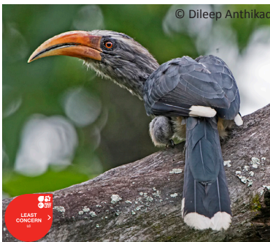
Image 10. Malabar Grey Hornbill